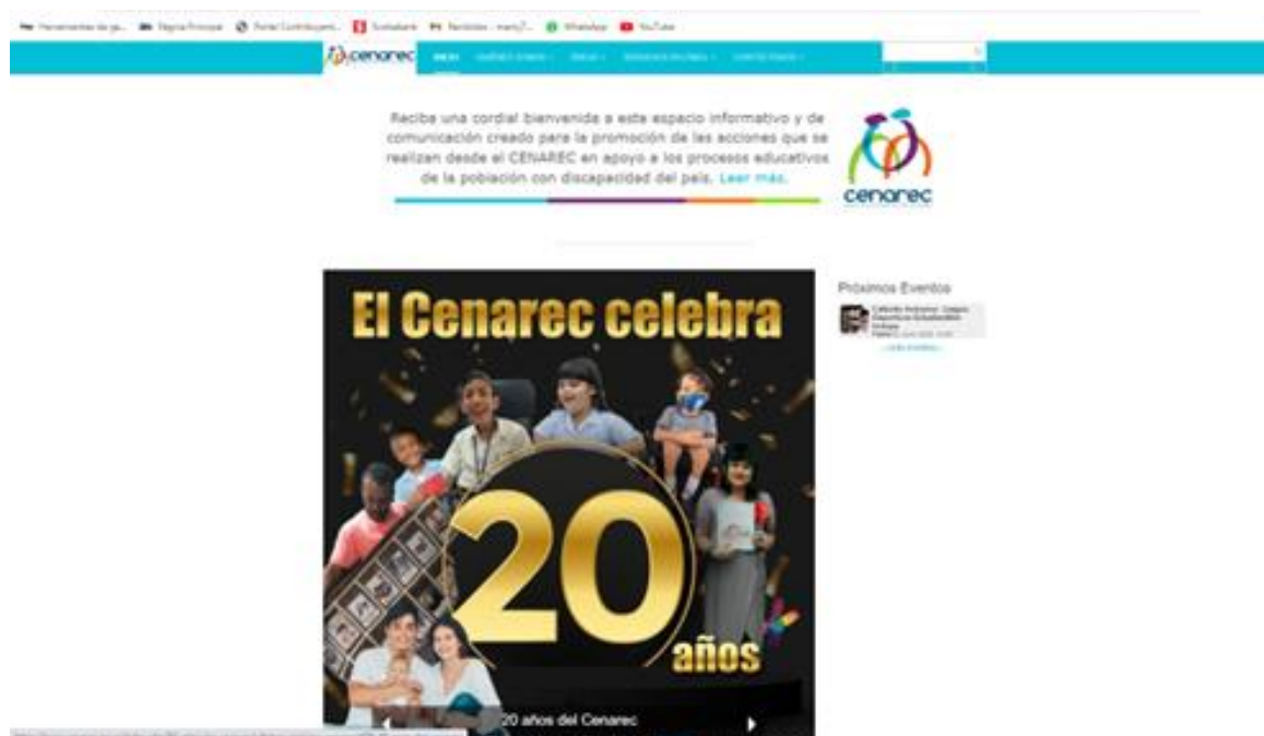
Ilustración 5: Imagen de inicio de la página Web del Cenarec

La divulgación continúa, hoy en día con publicaciones físicas y digitales en redes sociales como lo es el Facebook @cenareccr y en Instagram @cenarecmep