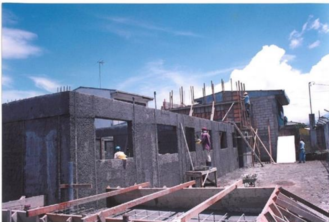
Ilustración 3: Fachada principal en construcción setiembre 2001.

Años después se incorporan las Sedes, el Centro de producción de materiales educativos en el sistema Braille, relieve y sonoro (CEBRA) y la Unidad de Tecnologías de la Información (UTI), de los cuales hablaremos en la segunda parte.