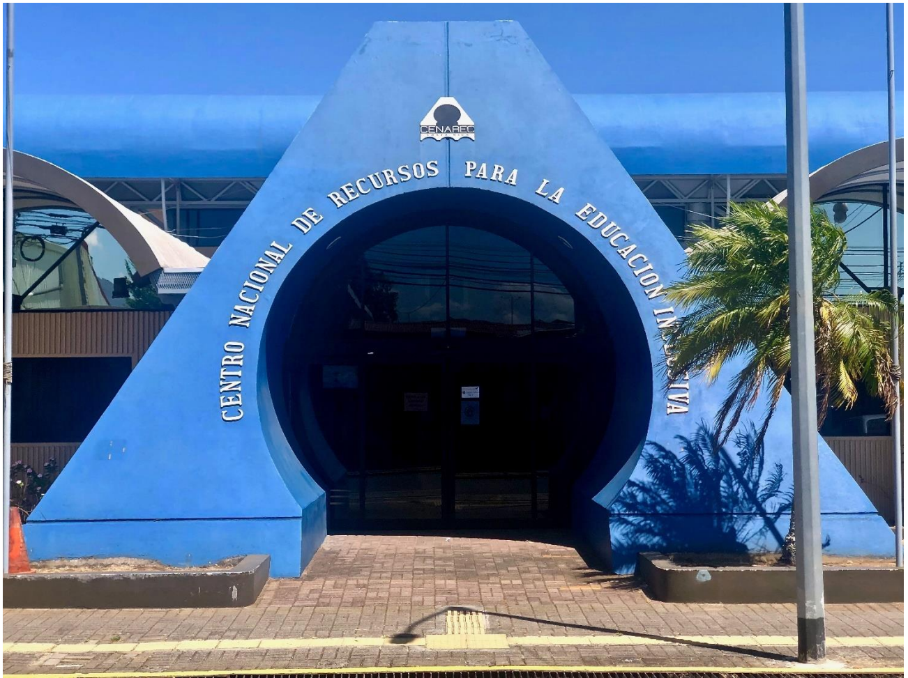
Ilustración 1: Fachada principal del edificio del Cenarec