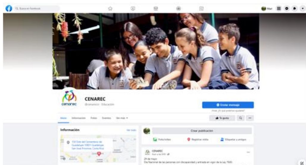
Ilustración 6: Imagen de la portada del Facebook del Cenarec