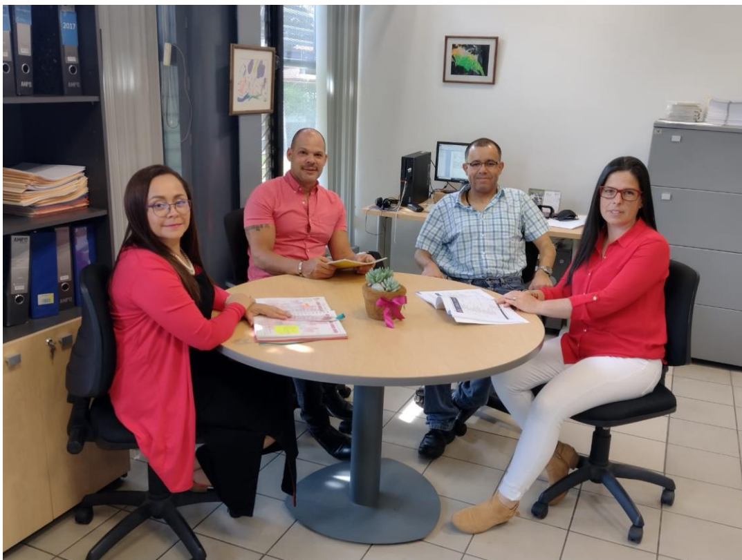
Ilustración 8: Funcionarios del Departamento de Capacitación en el año 2022

Para responder a las necesidades de capacitación y actualización de las personas involucradas en el proceso educativo, el departamento plantea, a lo largo del año, una oferta variada de cursos, los cuales se imparten tanto en las instalaciones del CENAREC, en regiones educativas, como de forma virtual, tomando en consideración las circunstancias del momento. Dichas actividades de formación permanente están dirigidas a personas docentes activas del Ministerio de Educación Pública, así como a familias, encargados legales, profesionales vinculados con la educación u otras personas que cumplan con los requisitos que están establecidos para cada uno de los cursos, los cuales pueden variar según la temática.