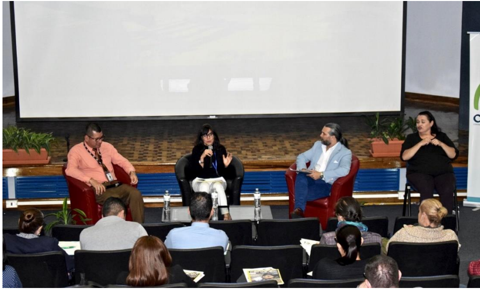
Ilustración 9: Evento realizado en el Auditorio del Cenarec