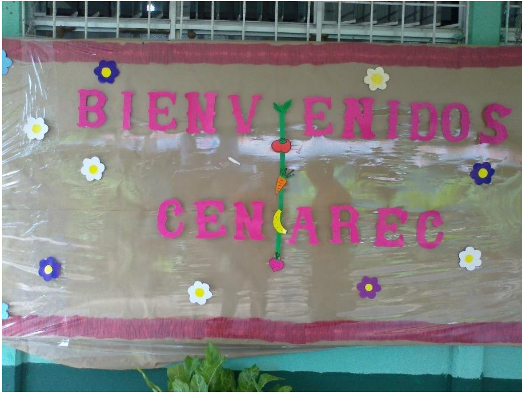
Ilustración 14: Pizarra de bienvenida a la sede de San Carlos