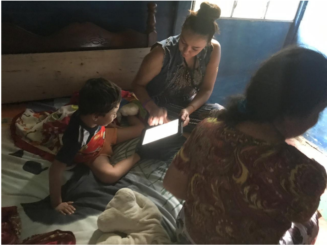
Ilustración 10: Funcionaria del Cenarec mostrando a un niño cómo utilizar una tableta