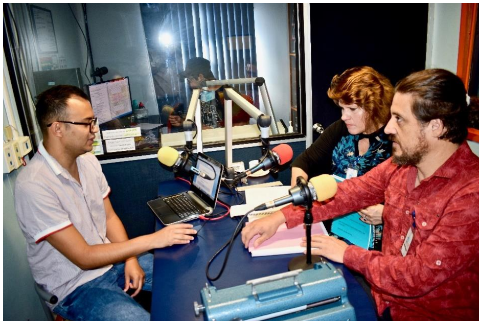
Ilustración 11: Presentación de funcionarios del Cebra en un programa radial

En el año 2021, para asegurarse que el centro siga brindando el servicio, pasa a formar parte del Departamento de Ayudas Técnicas del CENAREC.