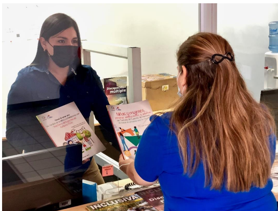
Ilustración 13:Recepcionista mostrando material de divulgación a una usuaria Sedes

Otra de sus funciones es la administración de los recursos humanos del Departamento Administrativo del centro, de acuerdo con las políticas institucionales y las normas vigentes; por otra parte, realiza el préstamo de instalaciones a las organizaciones relacionadas con la temática de discapacidad y educación inclusiva, para que lleven a cabo las actividades que requieran de un espacio que albergue cierta cantidad de personas, en un ambiente adecuado y en las mejores condiciones.