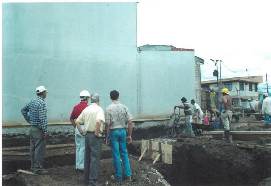
Ilustración 2: Trabajadores haciendo los cimientos del edificio, julio 2001

Para conocer quiénes somos, debemos conocer de dónde venimos.