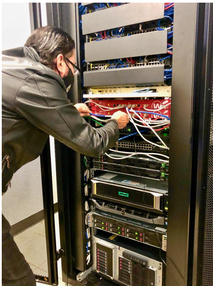
Ilustración 15: Funcionario de la UTI en el cuarto de servidores